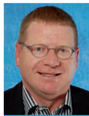
Bisher / précédemment Schöpfer Christian 1967, Leimera 1 Geschäftsführer Gérant