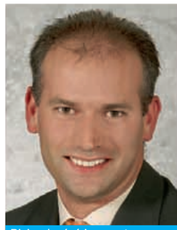
Bisher / précédemment Ith Markus 1972, Zigerli 15 Betriebsökonom FH Economiste d'entreprise HES