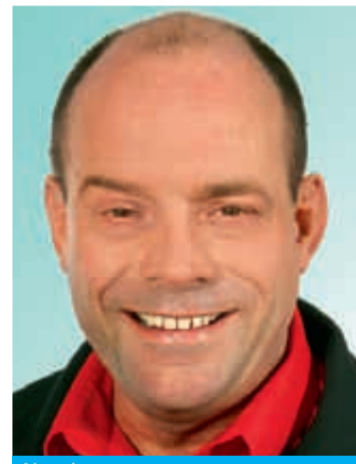
Neu / nouveau Marti Beat 1961, Beinhausweg 2 Kaufmann Commerçant